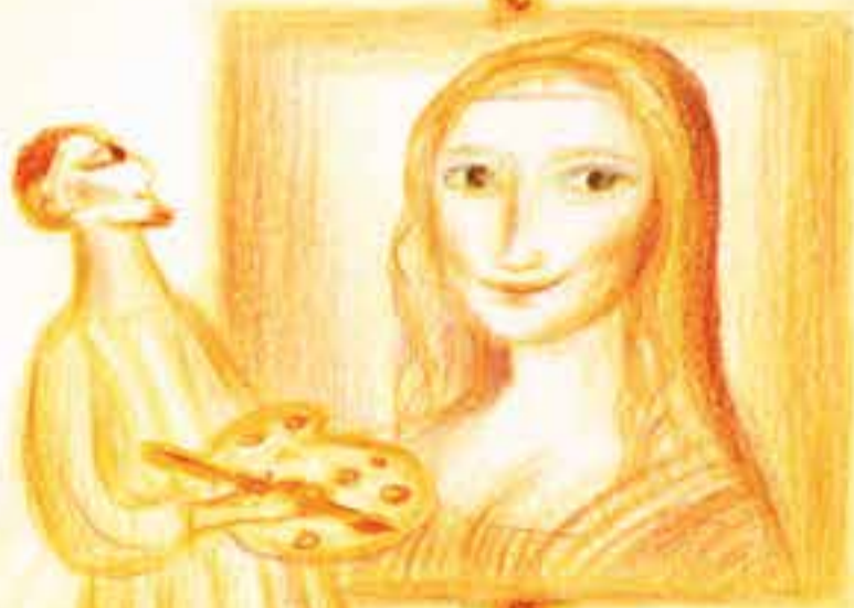
Aneta 8. B, 1. ZŠ Velké Meziříčí

uměl dobře angličtinu být zdravý mít dobré povolání letět letadlem počítač